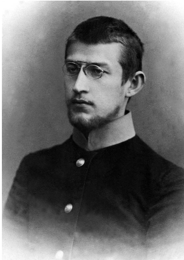
Яков Бойков. Тверская Духовная семинария