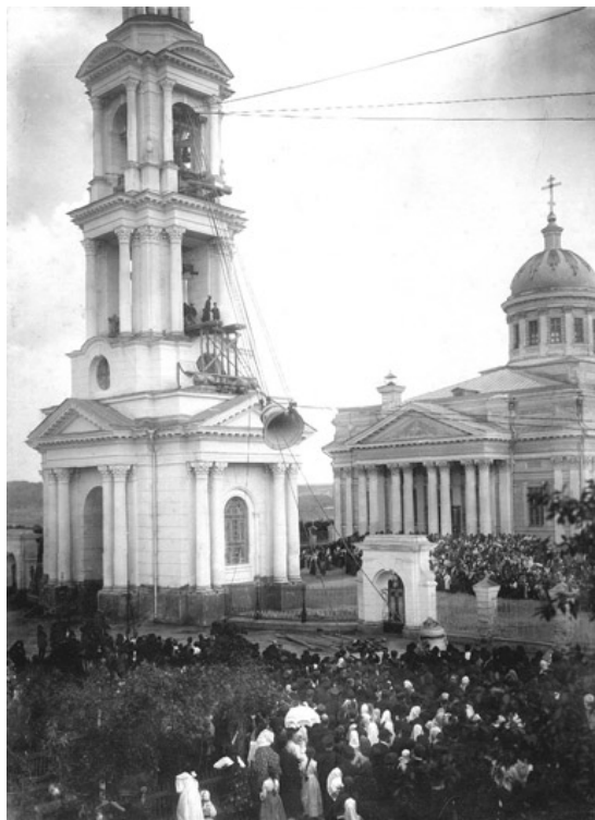
Яхрома. Поднятие колоколов

имущества, и на ночь ставили раскладушки, а поскольку и их было недостаточно, то укладывались на них по двое. Иногда власти вызывали отца Сергия на ночные допросы. Жена священника посылала вместе с ним дочь Юлию, которая усаживалась на деревянном диванчике в районном отделении НКВД и ждала, когда отпустят отца. А мать в это время дома молилась. В 1930 году храм был закрыт. Закрытию храма предшествовало снятие колоколов. Для священника это явилось большим потрясением, и, глядя на происходящее варварство, он заплакал.