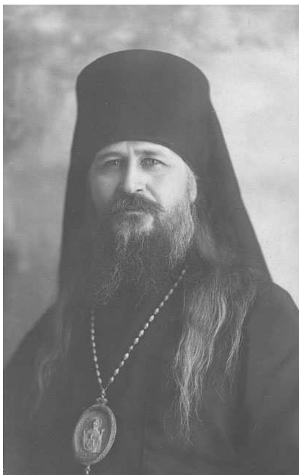
Архиепископ Прокопий (Титов)

В прошлом году, когда из Хэ увезли митрополита Петра Крутицкого и я ему об этом сообщил, что, вот, увезли митрополита, видимо, освободился, он на это сказал: "Какая разница, что его увезли из одной местности, все равно пошлют в ссылку в другое место. Вот я отбыл срок в Соловках, а после этого, вот видите, послали в ссылку. Отбуду здесь срок ссылки, все равно пошлют в другое место. В данное время нам, духовенству, попавшему и попадающему в ссылку, ссылку никогда не отбыть, нам власть не только не разрешит служить в церквях, но и быть на родине".