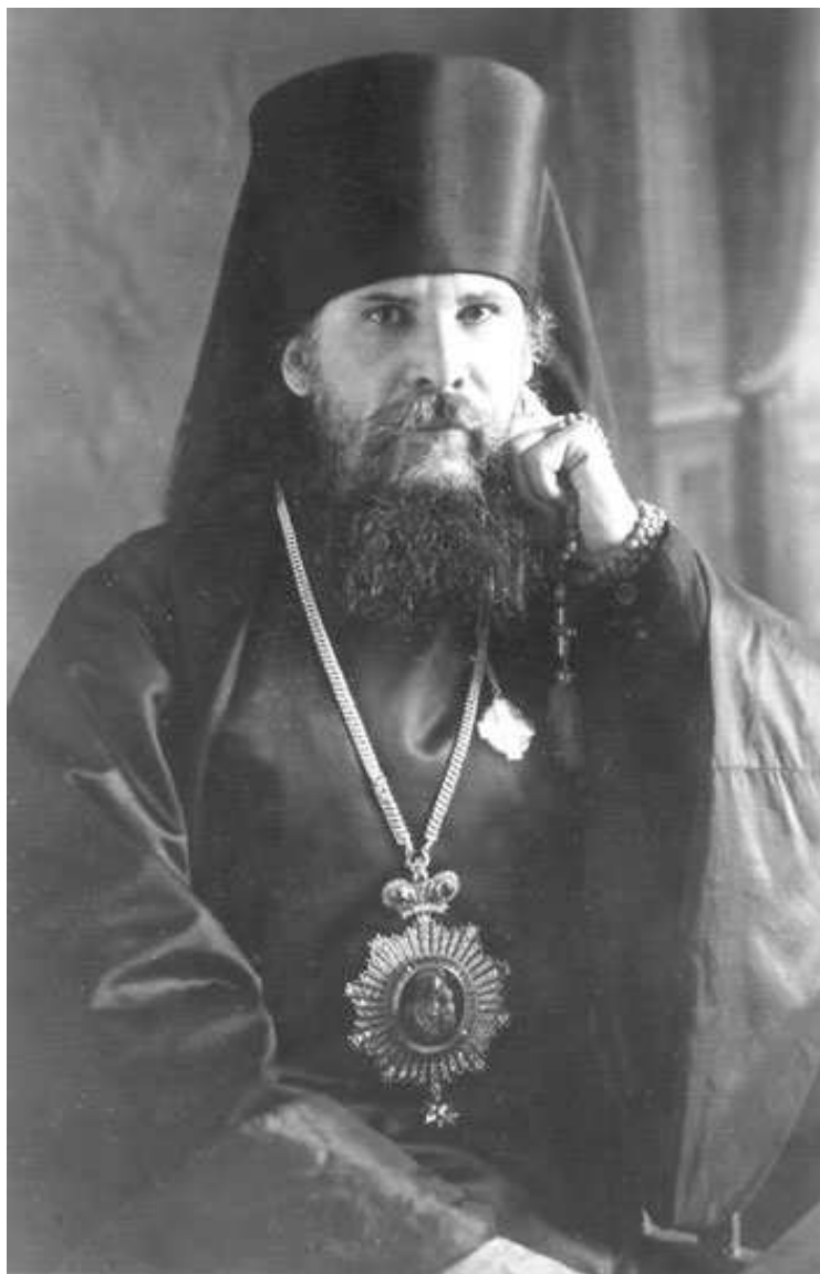
Епископ Сызранский Августин

который является соборным старостой... но не отрицаю, что духовенство, в лице отдельных лиц, по делам богослужебного характера у меня на квартире бывало, а также бывали на квартире и представители церковных обществ, которые являлись для приглашения меня на богослужения. В пунктах предъявленного мне обвинения в систематической агитации и распространении провокационных слухов, а также психологической подготовке массы к предстоящей интервенции, в умышленной концентрации всего реакционного духовенства и торгового, монашеского элемента вокруг Казанского собора виновным себя также не признаю...»