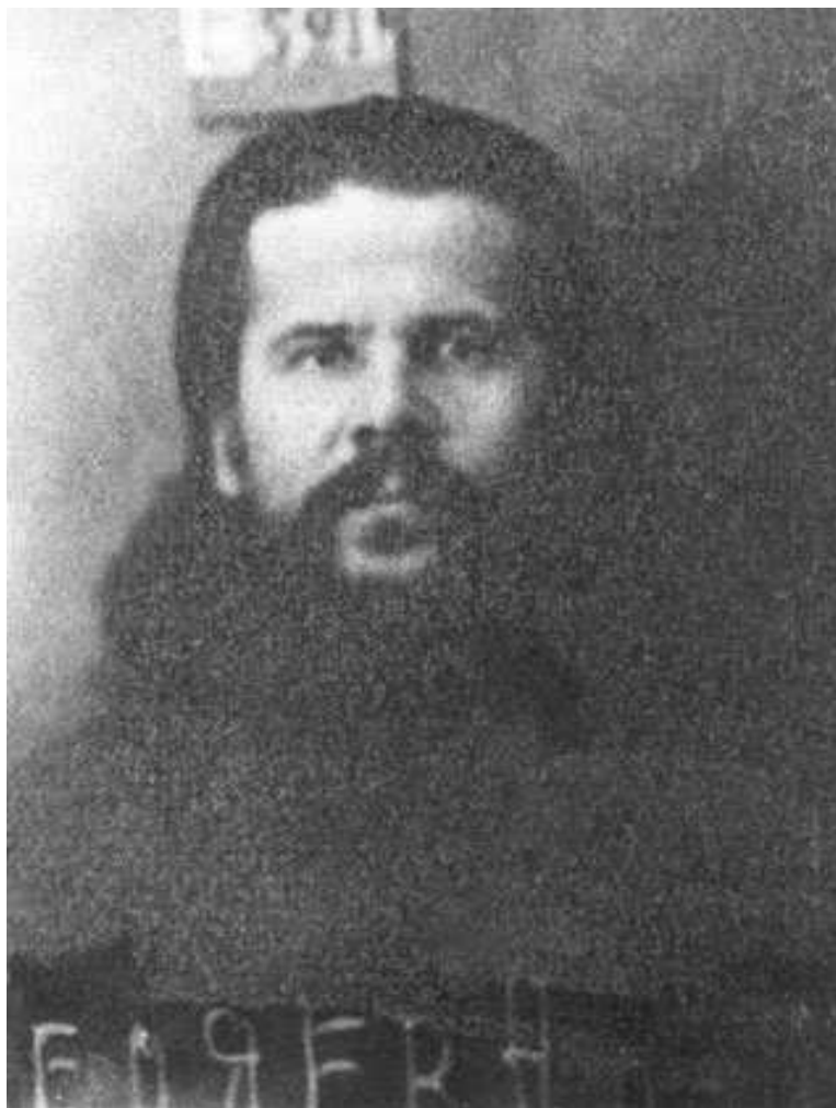
Епископ Августин. Москва. Бутырская тюрьма. 1926 год

полная, об этом свидетельствует факт отстранения от должности уездного уполномоченного. Что мои действия имели всегда свою целью сохранить добрые отношения с местной властью и ликвидировать возникающие конфликты, об этом может свидетельствовать губернский уполномоченный Иваново-Вознесенского ОГПУ... с которым в крайнем случае, если бы он стал отказываться от подобного засвидетельствования, я хотел бы иметь очную ставку».