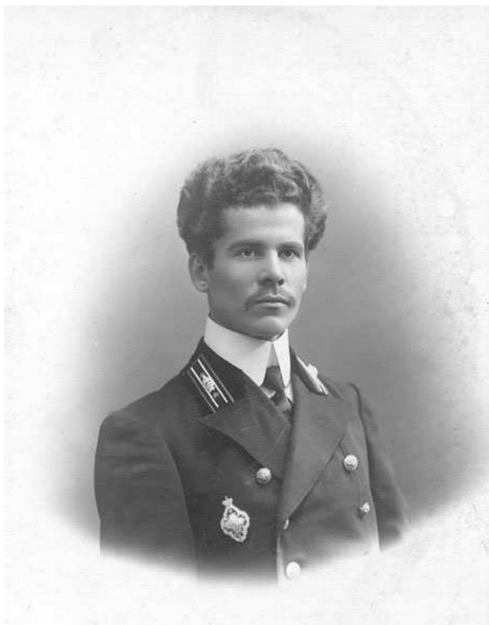
Александр Александрович Беляев. 1913 год